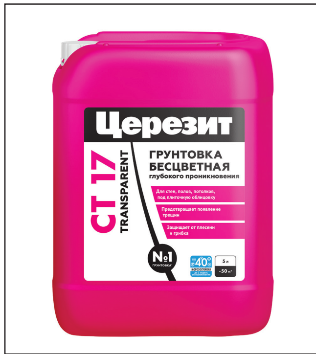
ЦЕРЕЗИТ_СТ 17 Transparent_12. 2025

Перед применением тщательно перемешать или взболтать содержимое емкости. Грунтовку наносят кистью или валиком, не допуская скоплений на поверхности. Время высыхания грунтовки