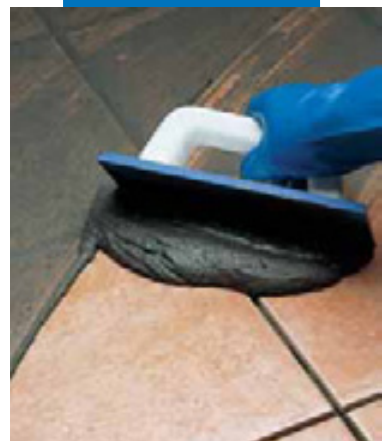
Заполнение швов в плитке на полу резиновым шпателем