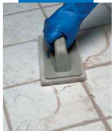
Очистка с помощью панели Scotch-Brite®